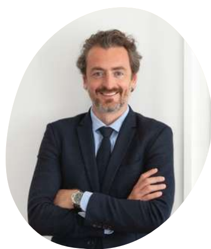
Ludovic Blanc Président national de l'ACE-Jeunes Avocats